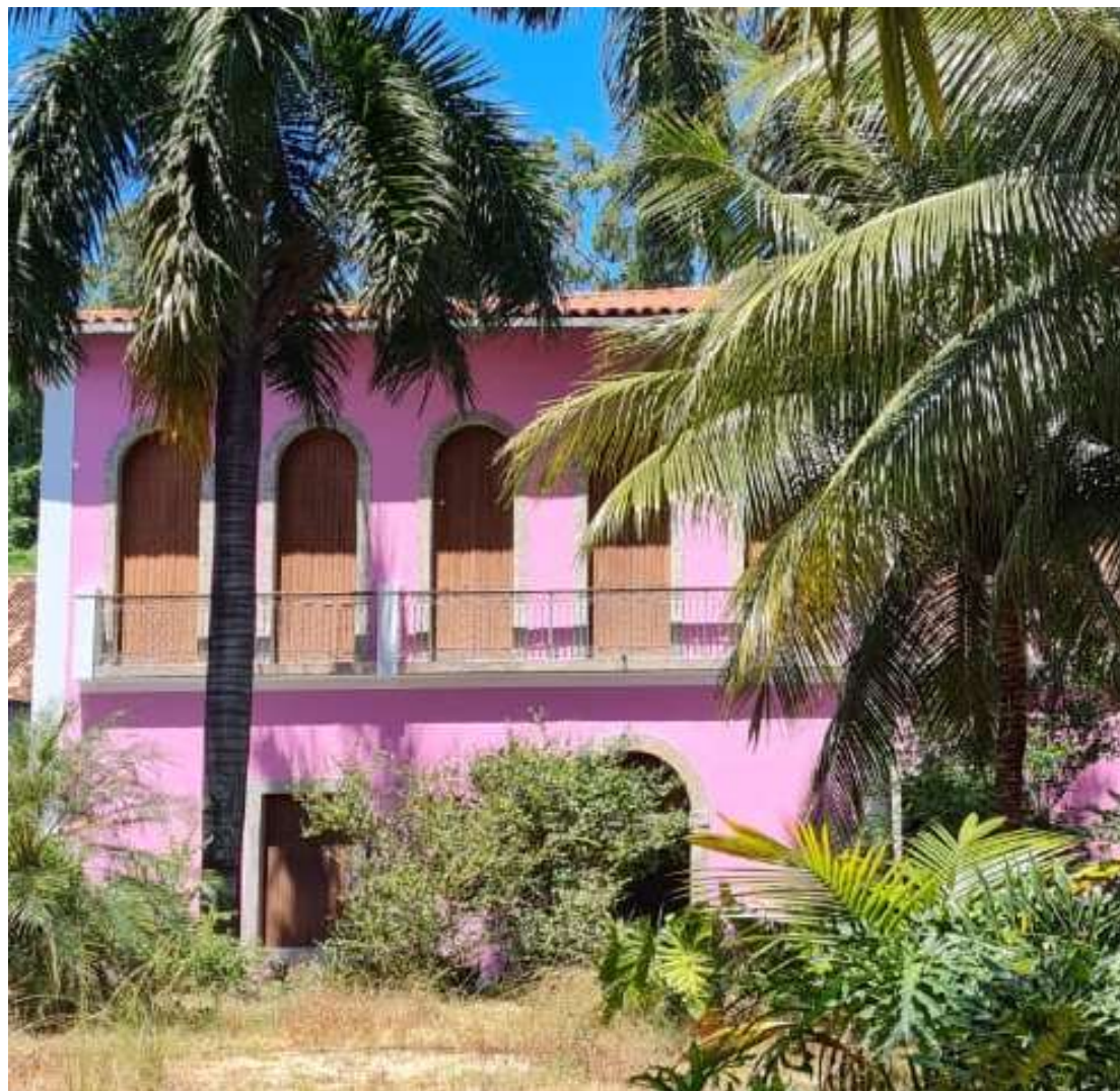
Foto: fachada atual do Casarão

O curso de Cinema foi reconhecido, em 2019, como patrimônio cultural imaterial de Niterói